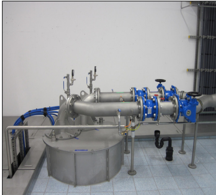
Das neue Grundwasserpumpwerk Tägerhardwald.

Bitte beachten: Letzte Seite gilt als Stimmrechtsausweis